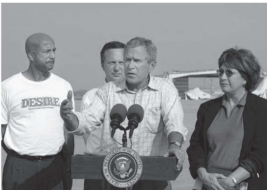
Ray Nagin, então prefeito de Nova Orleans, Michael Brown, então diretor da FEMA, George W. Bush, então presidente dos EUA e a Kathleen Blanco, então governadora de Louisiana.

Este caso examina a colaboração entre a Fema e a organização mais importante durante o Katrina: o Departamento de Defesa (DOD). Por várias vezes, o DOD apareceu tomado pela inércia, enquanto, em outras