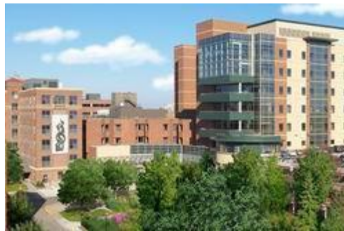
La nueva sede principal de Abbott Northwestern

□ Abbott Northwestern Hospital empleó a 5,300 personas, agregó $170 millones en instalaciones a su campus y triplicó a 900 el número de residentes de Phillips que trabajaban en el hospital.