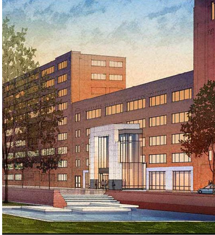
Wells Fargo Home Mortgage

□ Allina Health Systems mudó su sede principal a Phillips, al Midtown Exchange de $190 millones, el cual tenía 2,000 empleados y 350 apartamentos y condominios nuevos.