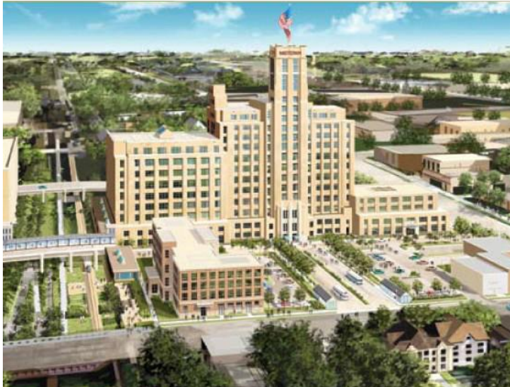
Caption: Midtown Exchange

Phillips también estaba mejorando en otras medidas. Aunque el vecindario Phillips iba adelante en el número total de delitos graves en 1998 con el 7 por ciento del total de la ciudad, éste se redujo al 4 por ciento en el 2006. De acuerdo con el informe más reciente del condado Hennepin en el 2002, el 40 por ciento de los residentes de Phillips—el segundo más alto de cualquier vecindario del condado Hennepin—estuvieron de acuerdo o fuertemente de acuerdo con la afirmación: “Esta no es una comunidad muy buena para criar hijos.” Esto representaba una reducción de solo 4 puntos porcentuales desde 1998.