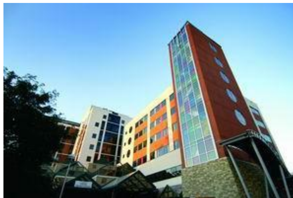
Torre del nuevo Children’s Hospital

□ Children’s Hospital and Clinics empleó a 2,225 personas, agregó una torre de $15 millones de dólares y anunció planes para una mayor expansión de sus instalaciones.